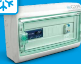
rECOBox 2 Klima