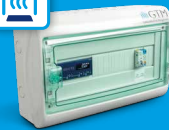
rECOBox 3 Türschleier