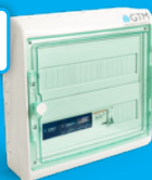
rECOBox 2B Heizen / Kühlen