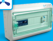
rECOBox 1B Lüftung