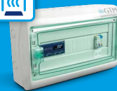
rECOBox 3 Türschleier