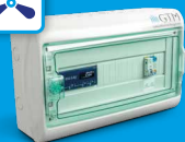
rECOBox 1 Lüftung