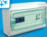
rECOBox 2 Klima